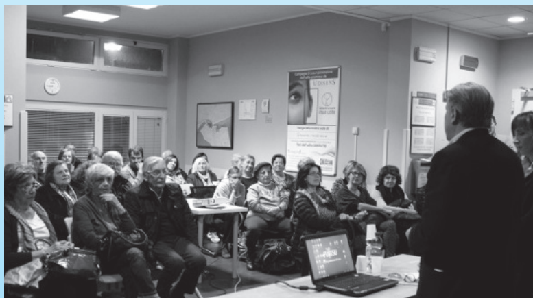
Uno degli incontri alla CdS Montanara del 2015