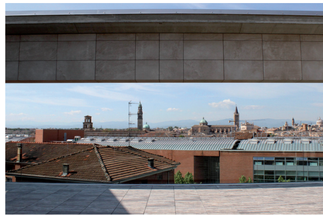
La vista dalla terrazza

il Programma Disturbi del Comportamento Alimentare con anche l'Associazione Sulle Ali delle Menti, il Centro di terapia della famiglia e l'équipe funzionale dei percorsi di cura degli adolescenti composta dai professionisti della neuropsichiatria infantile, dei centri di salute mentale e del servizio dipendenze patologiche. Al secondo piano ci so-